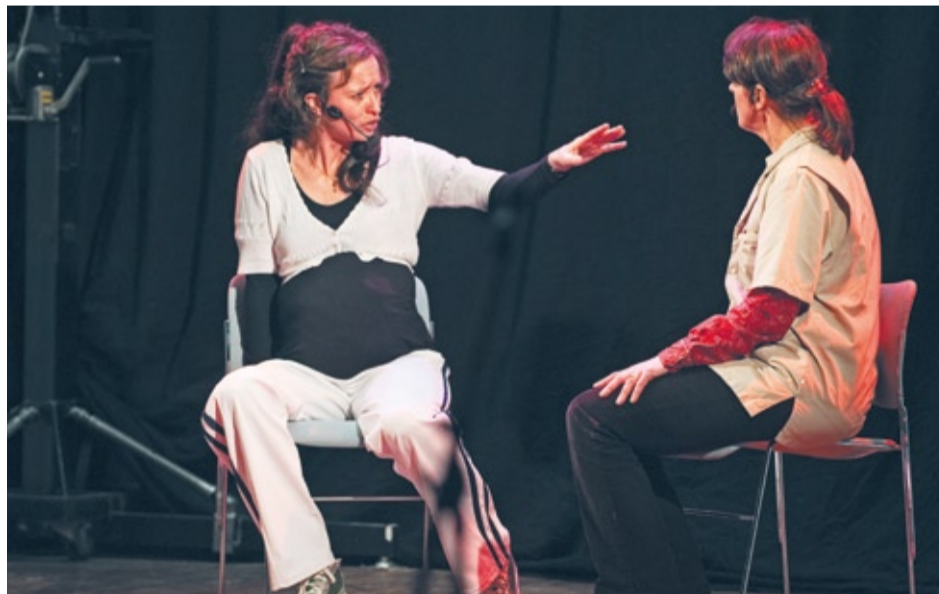
Tijdens het symposium 'De vrijblijvendheid voorbij', maakte een theatergroep inzichtelijk welke weerstanden en dilemma's er spelen bij de aanpak van kindermishandeling.

Kindermishandeling kent vele vormen, van kinderen die lichamelijk of emotioneel mishandeld of verwaarloosd worden tot kinderen die getuige zijn van huiselijk geweld. Om kindermishandeling vroegtijdig te signaleren is Tergooi gestart met een scholingsprogramma voor kinderartsen, arts-assistenten en verpleegkundigen op de Spoedeisende Hulp. Bovendien is op de Spoedeisende Hulp een signaleringslijst ingevoerd, die de verpleegkundigen invullen bij elk kind dat voor behandeling bij hen komt. De gegevens van deze signaleringslijsten komen ook in een nieuw digitaal registratiesysteem, waardoor bijvoorbeeld meteen duidelijk wordt of een kind eerder 'onder onduidelijke omstandigheden' op de Spoedeisende Hulp is geweest. Mocht het vermoeden rijzen dat mishandeling in het spel is, dan