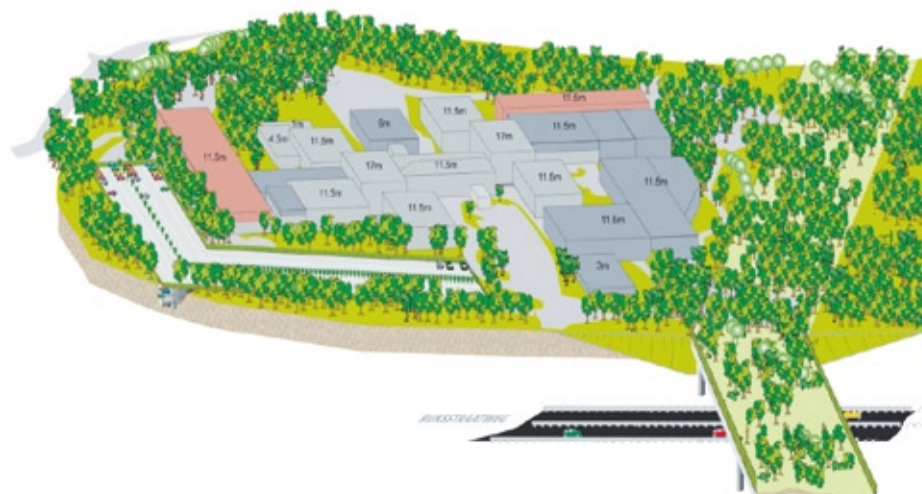
Tergooi Blaricum in de toekomst: met uitbreiding aan de west- en oostzijde; rekening houdend met de planten, dieren en het landschap om het ziekenhuis.