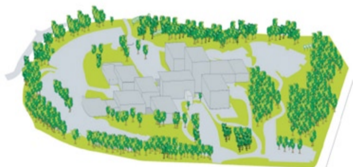
Huidige situatie Tergooi Blaricum

Ook voor Tergooi Hilversum wordt beschreven welke uitgangspunten voor het nieuwe ziekenhuisgebouw gelden. Tergooi Hilversum is onderdeel van het bovenregionale zorgpark. De gemeenteraad van Hilversum zal deze plannen in zijn geheel bespreken.